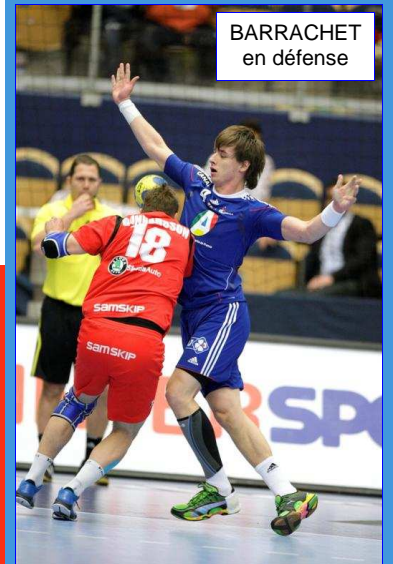
BARRACHET en défense