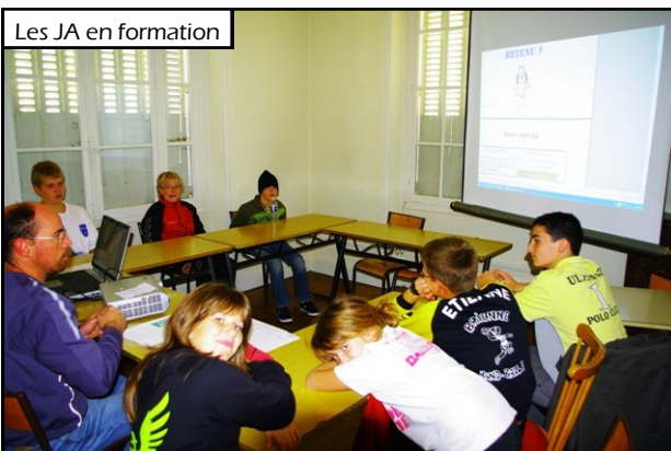
Les JA en formation

Ce travail de fond est important, il en va de la qualité de nos jeunes arbitres.